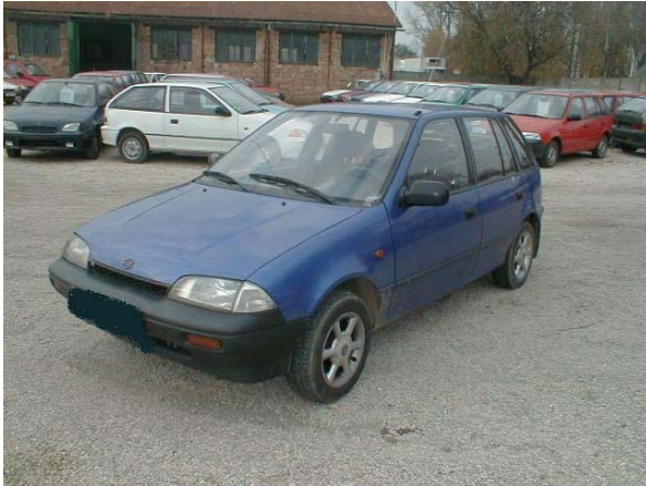
Gépjármű fényképe A, 3 /4-es előlnézet