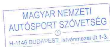
Botka Endre mb. RSB-vezető